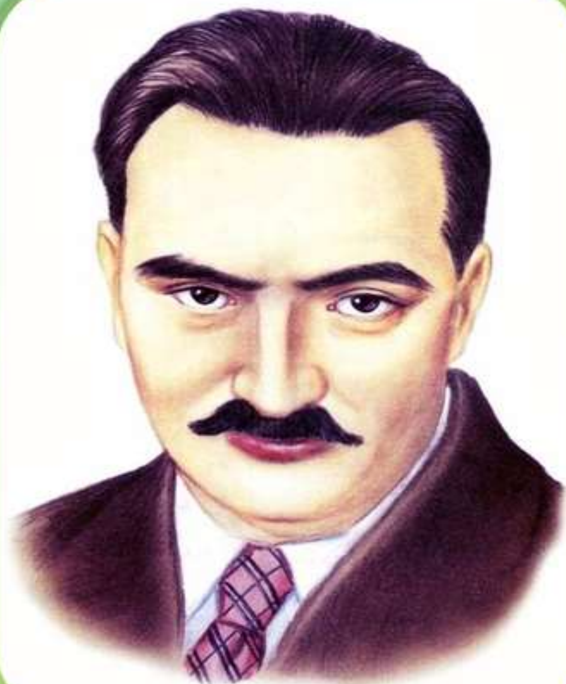
БИАНКИ Виталий Валентинович