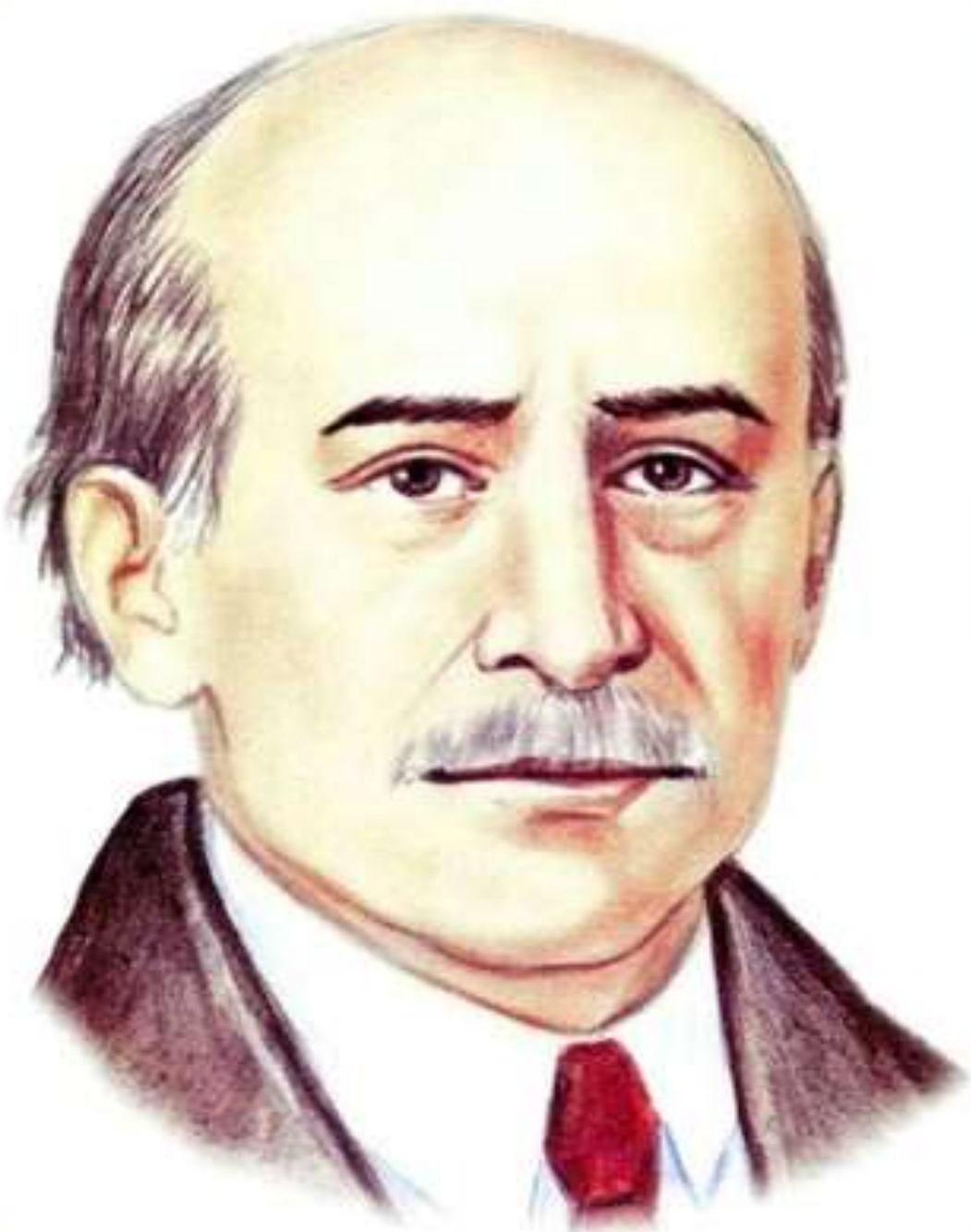
ЖИТКОВ Борис Степанович