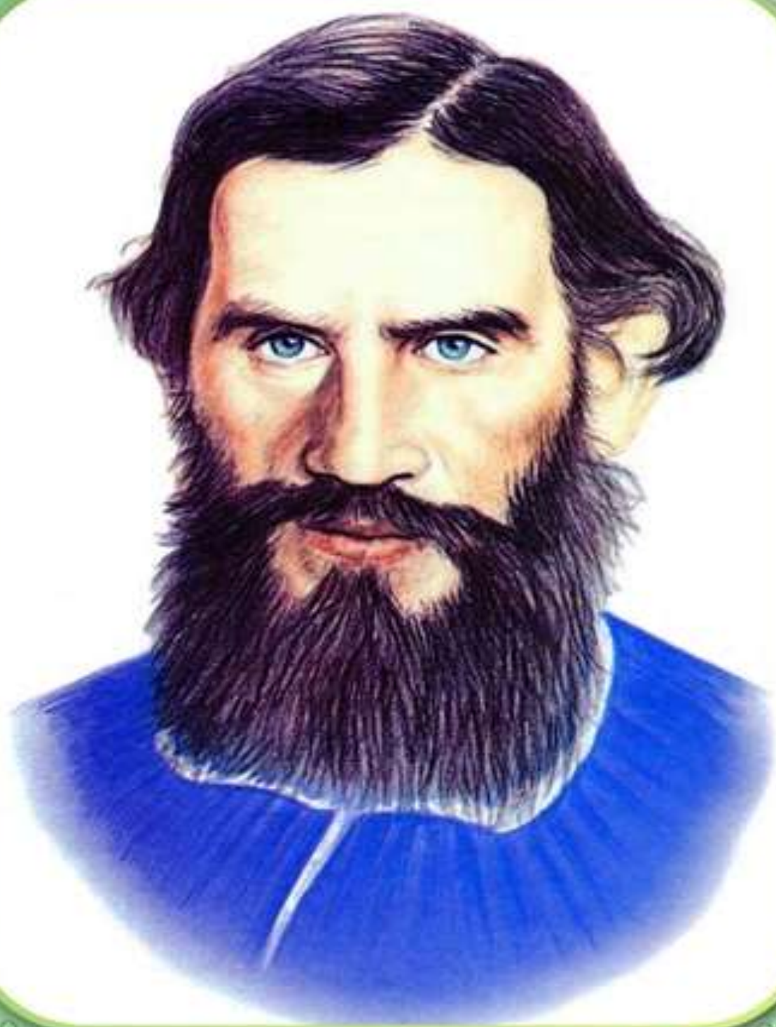
ТОЛСТОЙ Лев Николаевич