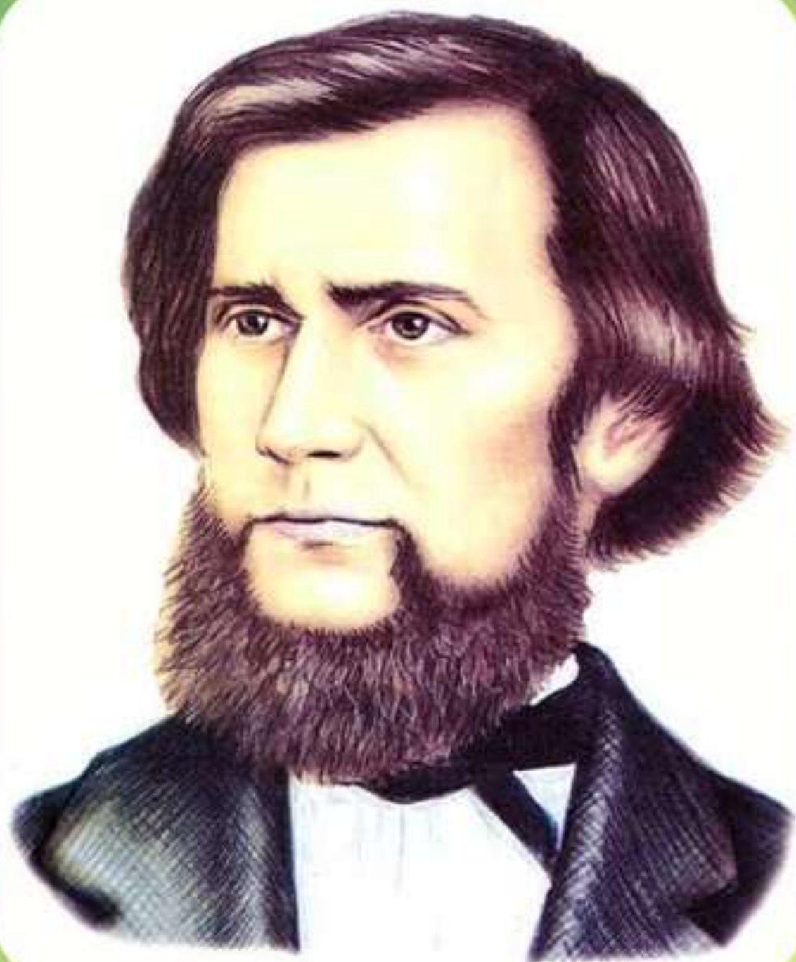
УШИНСКИЙ Константин Дмитриевич