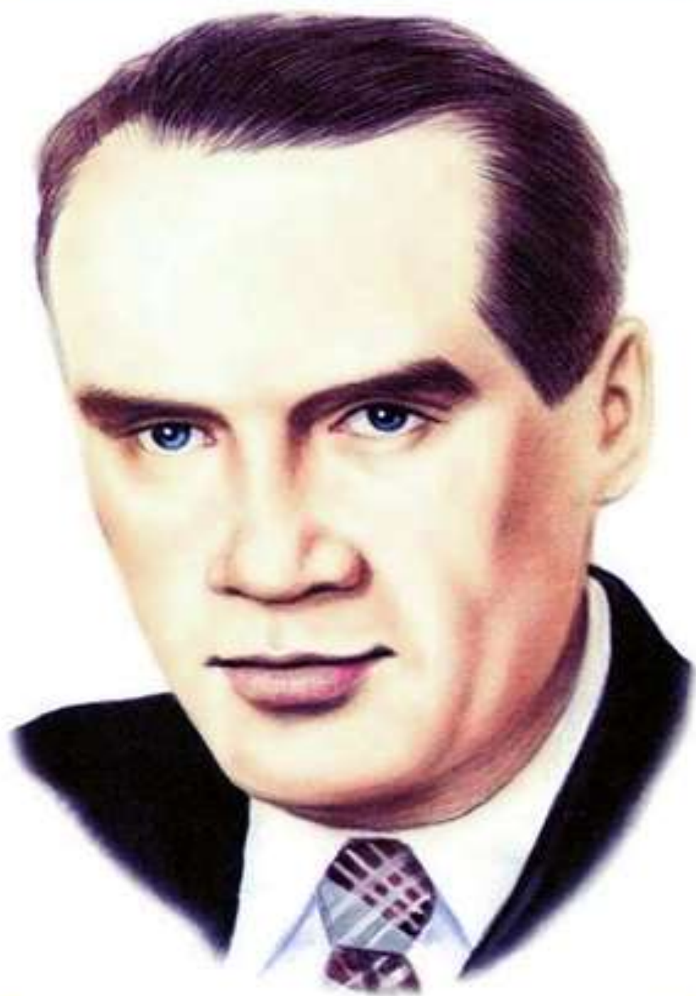
НОСОВ Николай Николаевич