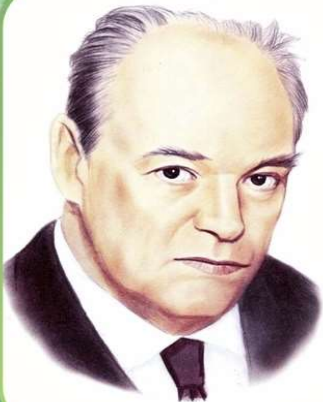
ЧАРУШИН Евгений Иванович