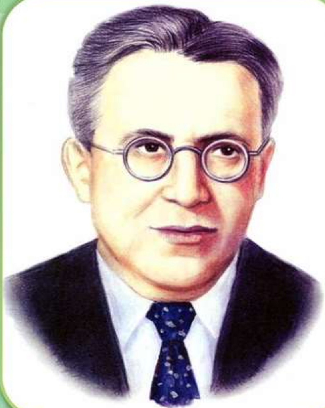
МАРШАК Самуил Яковлевич