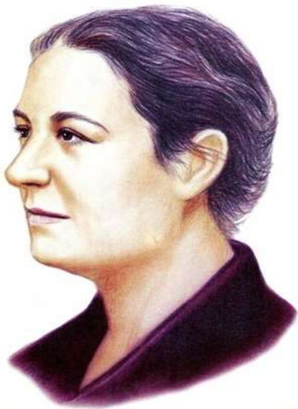
БАРТО Агния Львовна