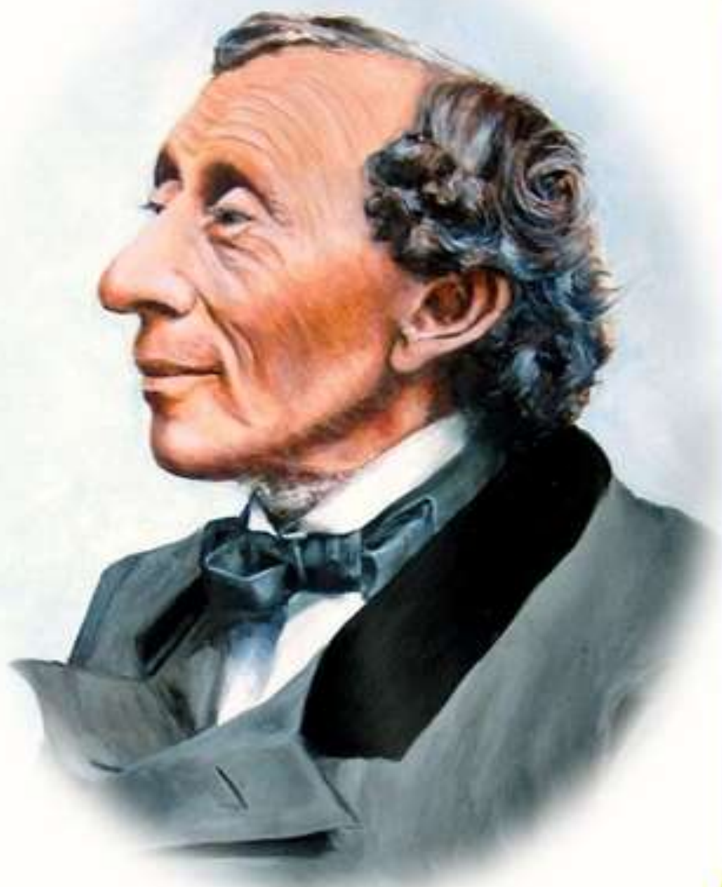
АНДЕРСЕН Ганс Христиан