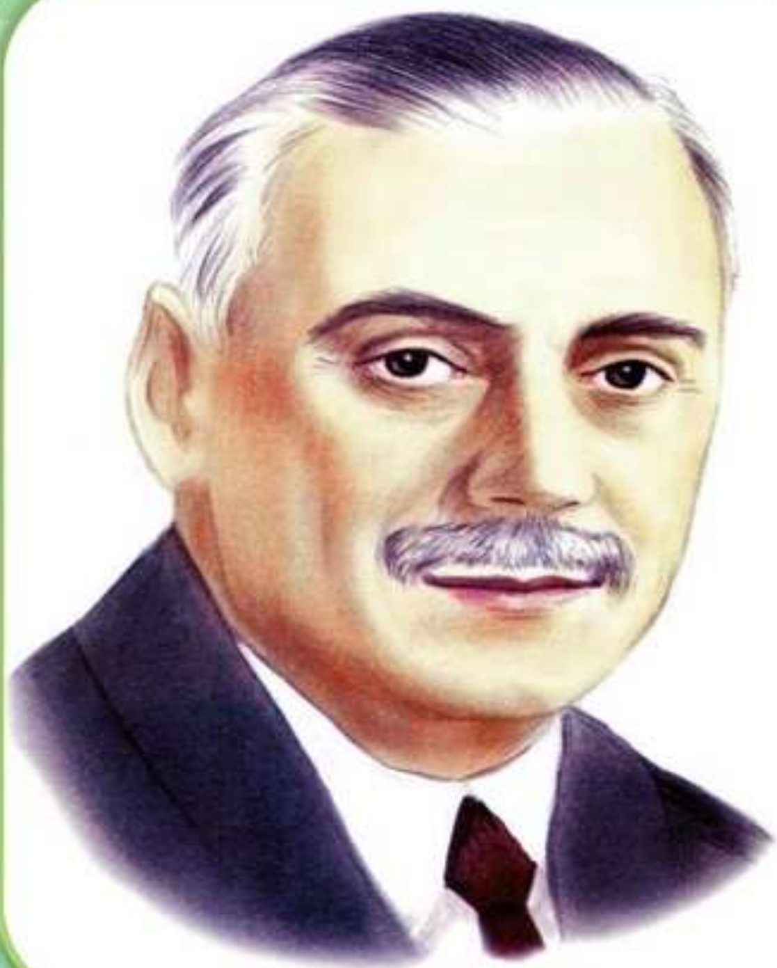
МИХАЛКОВ Сергей Владимирович