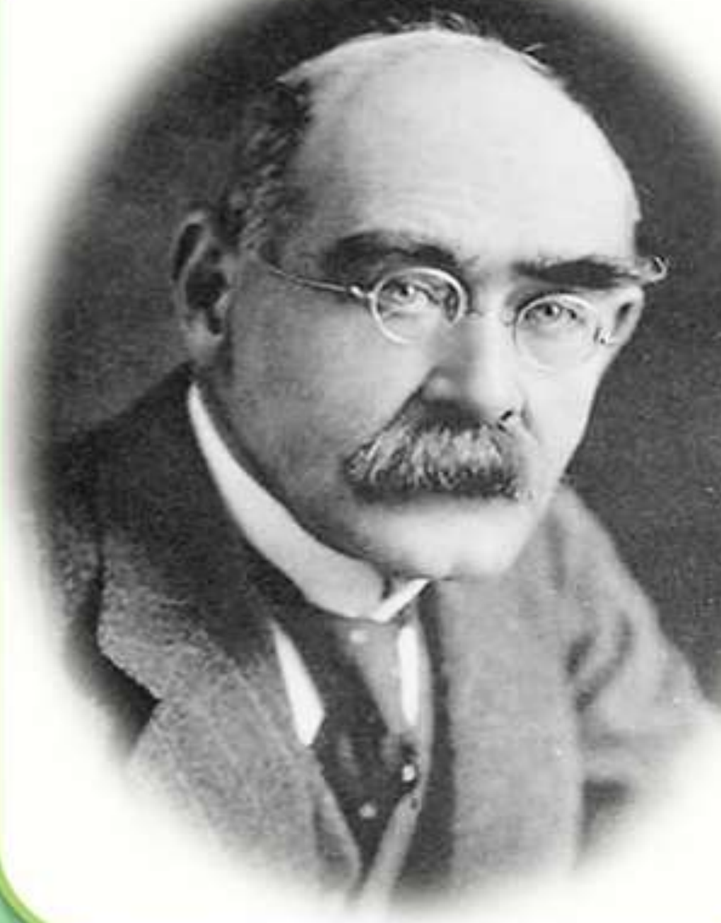
КИПЛИНГ Джозеф Редъярд