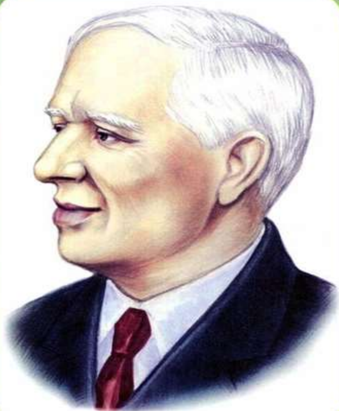
ЧУКОВСКИЙ Корней Иванович