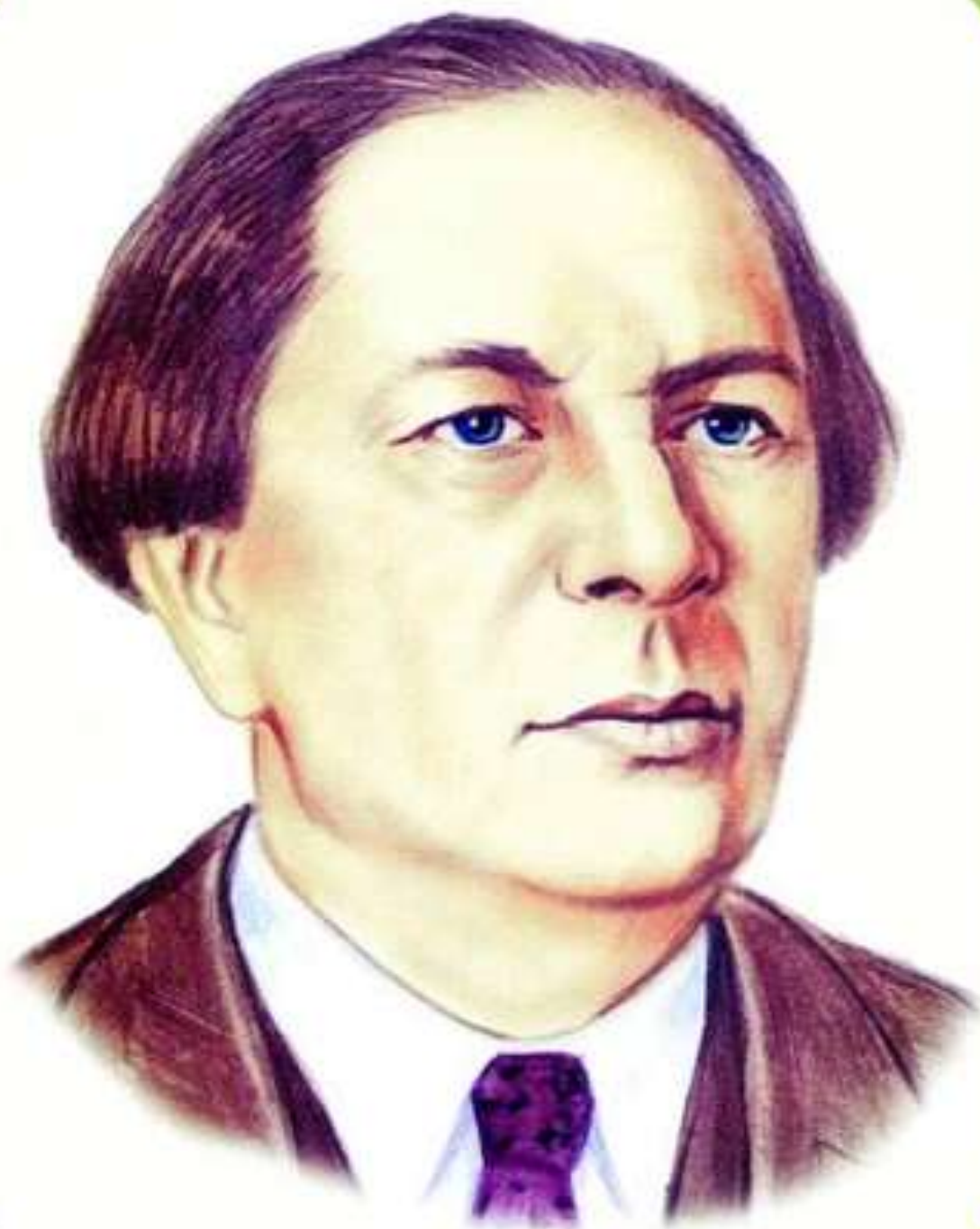
ТОЛСТОЙ Алексей Николаевич