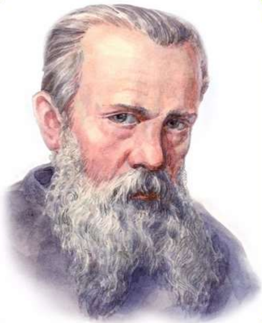
БАЖОВ Павел Петрович